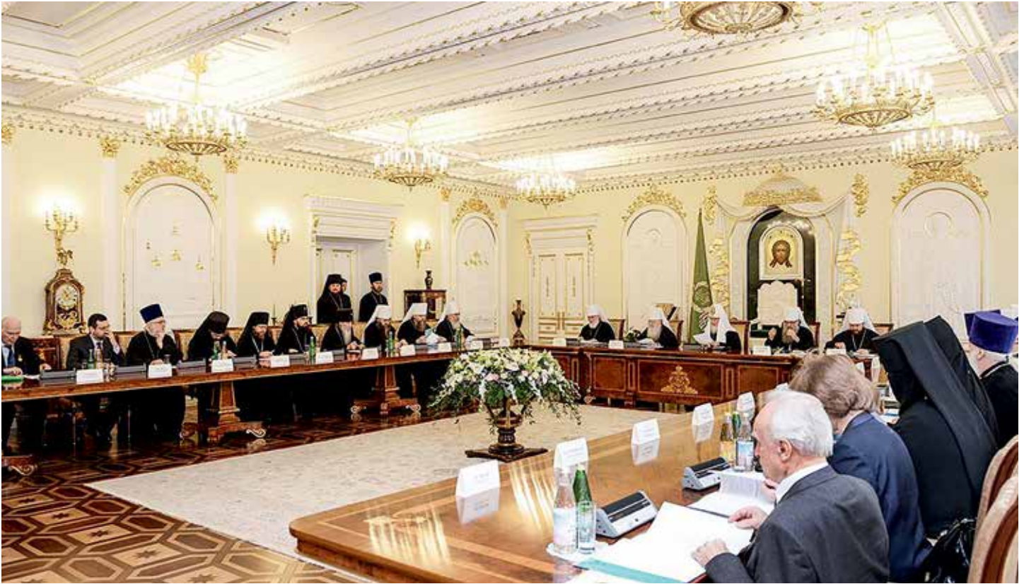
Заседание президиума Межсоборного присутствия Русской Православной Церкви 28 января 2015 г.

обещание исполнения крещальных обетов. Ибо крещение без твердого намерения изменить свою жизнь не принесет человеку пользы, и ему, как и крестным, придется за это отвечать перед Богом.