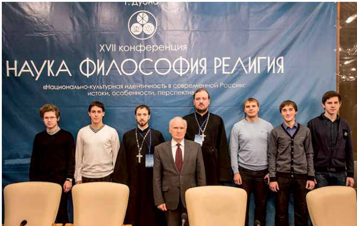
На XVII ежегодной конференции «Наука. Философия. Религия». 25–26 ноября 2014 г.

часто не зная друг друга, согласно утверждают одно и то же, то совершенно ясно, что здесь говорит уже не просто ум, эрудиция человека, не его домыслы, а голос Святого Духа. Да, и такими вопросами, как правило, являлись самые основные: вероучительные и аскетические. Это хорошо выражено в основополагающем правиле: In necessariis unitas, in dubiis libertas, in omnibus charitas («В главном — единство, во второстепенном — свобода, во всем — любовь»). Такое согласие отцов действительно — основа истинного богословия.