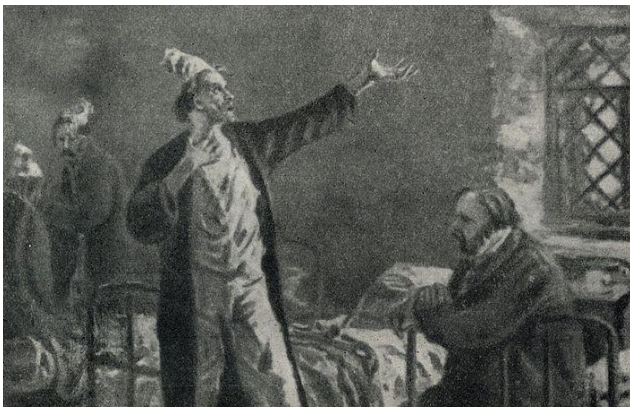
А.П. Чехов. «Палата № 6». Беседа доктора Рагина с Громовым. Рисунок А. В. Ванецяна. 1954

У Антона Павловича Чехова в его интересном рассказе «Палата № 6» один из героев говорит: «И зачем все эти извилины в мозгу? Зачем все эти мысли, желания, зачем это мировоззрение, зачем эта наука, эта техника?.. Зачем всё это, если я точно знаю, что я умру и превращусь в прах такой же, как и всё, что мы видим, слышим и наблюдаем? Зачем и кому всё это нужно?» Чехов очень хорошо здесь поставил вопрос, перед которым останавливаются многие люди.