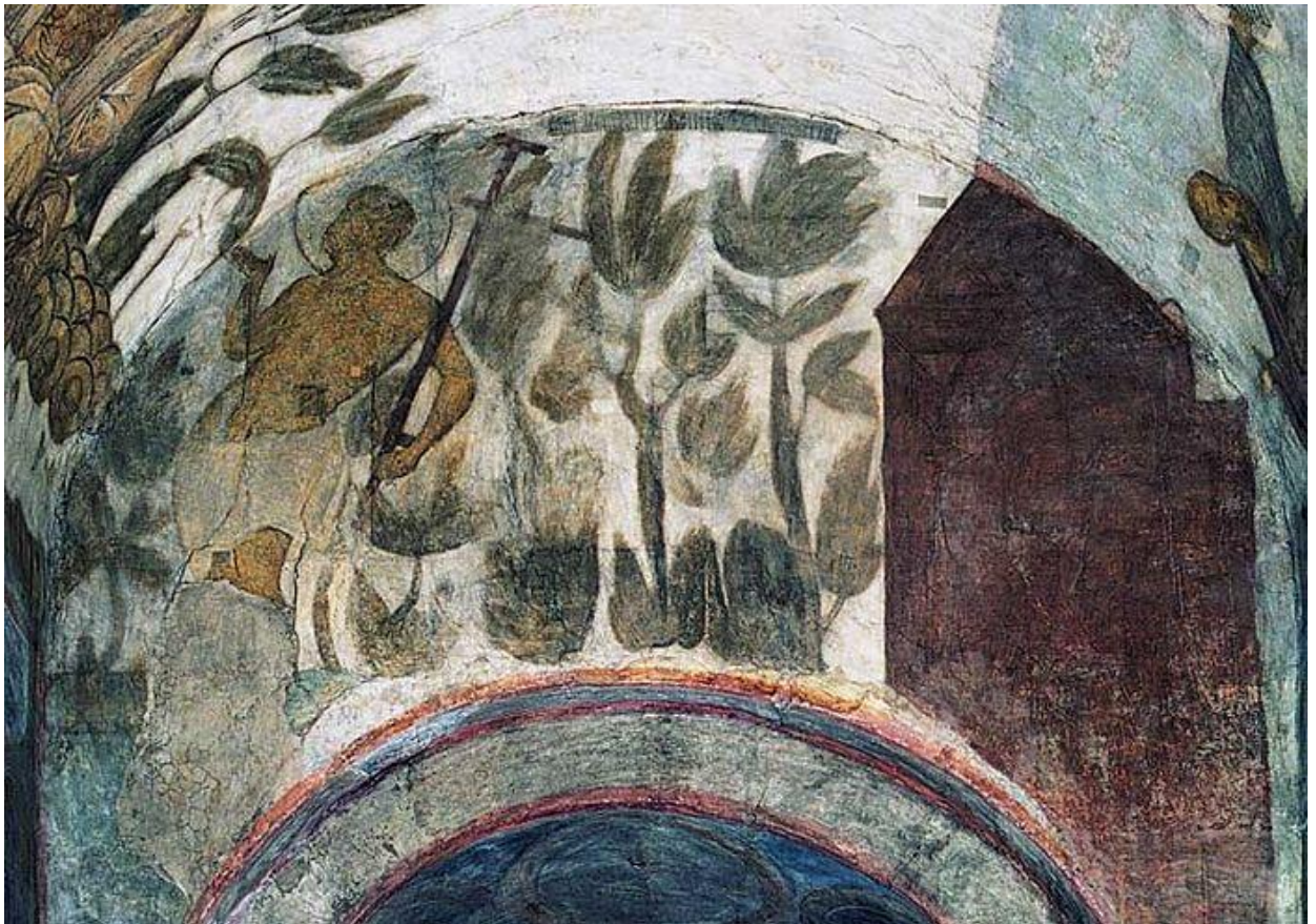
Даниил. Райские врата и благоразумный разбойник. Фреска западной люнеты в южном нефе. Владимир, Успенский собор. 1408 г.

А нравственность ведь вещь достаточно простая, требования здесь ясные, четкие и понятные, они касаются поведения человека в этом мире и его отношения к этому миру. Они же совершенно очевидны, эти отношения: нельзя убивать, нельзя красть, нельзя причинять зло человеку... Христианство говорит: «Нет, дело не просто в нравственности». И указывает на Евангелие. Кто распял Христа? Исполнители нравственного закона иудейской религии! Они оказались отверженными от Бога, предателями Бога. Кто первый спасся? Это невероятный парадокс: преступник и бандит. Оказывается, условием вхождения в вечность является не просто нравственность. Человек может быть нравственным, исполнять все нравственные предписания, но это может быть человек с такой гордыней, с таким самомнением, с таким тщеславием, с такой завистью! Это страсти, которые внутри нас. Это характеристики его духовного состояния. Вот христианство и говорит: для достижения вечной жизни требуется не просто нравственность.